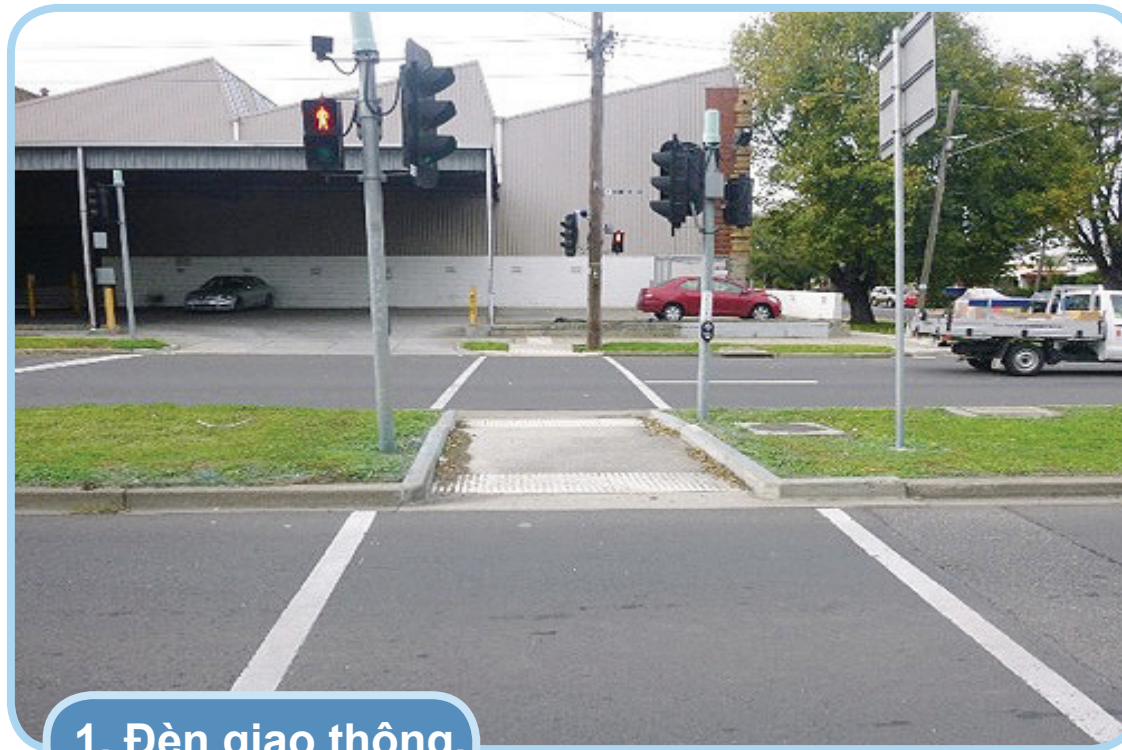
1. Đèn giao thông.