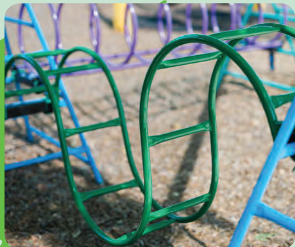
እና በመሰናክል ላይ መወጣጣት!