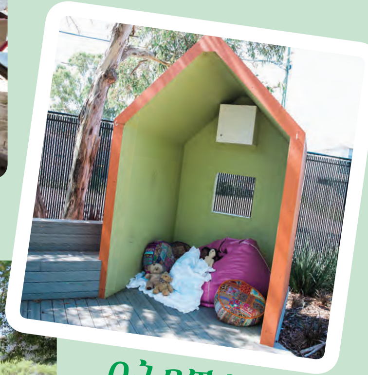
በትንሽ ክፍል ቤት ውስጥ መጫወት፤