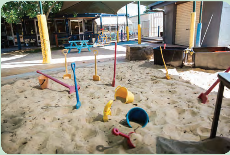
በአሸዋ ጉድጓድ ውስጥ መቆፈር፤